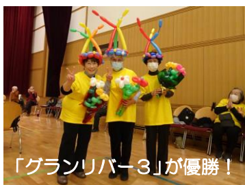
「グランリバー3」が優勝！

同地域では月1回、拠点を越えて合同練習をするなど、ポッチャを通じた交流と活動が継続しています。実行委員会は「他地域との交流試合や、子どもや障害者団体等の属性を超えた取り組みも進められれば」と意欲的です。