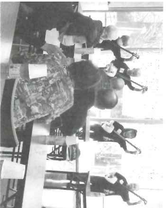
水無瀬・新水無瀬万葉

お気軽にご参加ください 次の地域でおこなっています。 江川一丁目、高浜、高浜西、水無瀬、新水無瀬万葉、大岡、メゾン、イオンズグランリバー、ニユ1高浜