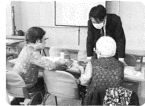
なるほど、ようわかったわ～。

3月24日ふれあいセンターで初心者対象のスマホ教室が開かれました。電源の入れ方、画面操作の仕方など、基本から学ぶことができました。