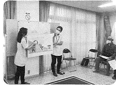
たんぱく質は大事ですよ

コロナ禍で出来なかったミニサロンを6月6日(火)に行いました。参加者13名、委員7名、ボランティア2名、保健師2名、栄養士1名、見学者2名、計27名の参加でした。保健師による血圧測定と