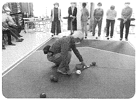
どっちが近いかな?

いっぱい一杯でしたが、久しぶりに楽しんでいただけだと思います。マスクについては自己判断にしました。