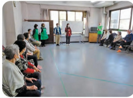
開会のあいさつとルール説明

「いきいきサロン」の当日、広瀬公民館のホールに縮小版のコートを作り上げ、座ったままでもプレーできるように、椅子も用意しました。久しぶりの秋晴れの暖かい日だったので、換気のために窓を全開していても寒くなく、申し込みをした人が26人。時間前には勢揃い。何をするのか興味津々。「パラリンピックで見た」という人もいました。