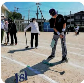
ホールポストに狙いを定めて！

マイクラブ持参の方もいらっしやうって、ホールインワン賞が9人。 なかには、前の球に当たって偶然ホールインワン