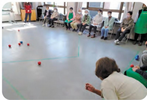
ちょっと遠くてむずかしいな！

マイクラブ持参の方もいらっしやうって、ホールインワン賞が9人。 なかには、前の球に当たって偶然ホールインワン