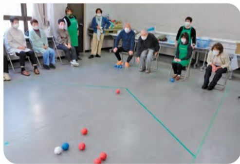
白をめがけてソーレ！