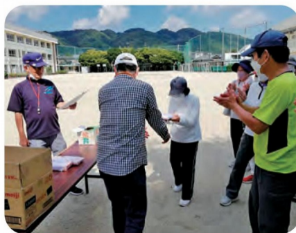
授賞式風景 おめでとございます

して、賞品をゲットされ喜んでおられた方もいました。 老いも若きも共に楽しくプレーしました。