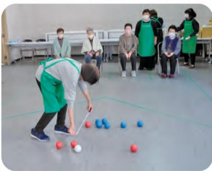
赤が白と青の半径内に何個あるかな？

4人一組で2人ずつに分かれ、赤か青のいずれかのボールを各自3個ずつ手にします。ジャンケンで先攻を決め、先攻チームが白の目