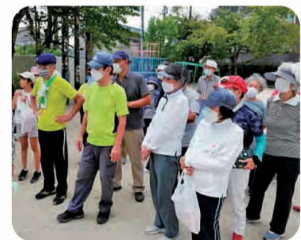
秋晴れの開会式風景

8組に分かれて、ボールをホールポスト目にかけて打ちます。真つすぐの方向に打つのが難しい。ホールポストの中心に当てるのがコツだと理解したけれど、出来ませんでした。 1ラウンドを終了すると、ブレイクタイム。久しぶりに会った友達とおしゃべり。2ラウンド目でやっとルールを理解しました。