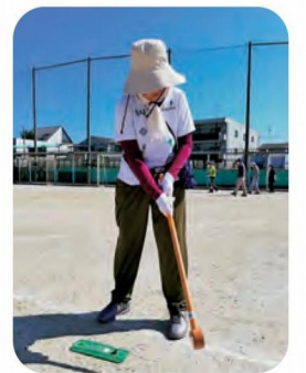
球をよく見てスイング！

して、賞品をゲットされ喜んでおられた方もいました。 老いも若きも共に楽しくプレーしました。