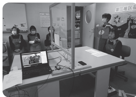
「ころころたまご」だよ～