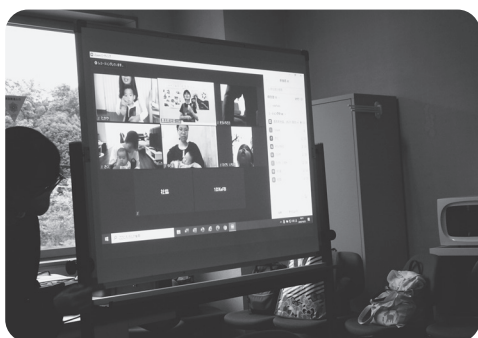
みんなと繋がってるよ

「ZOOMを使ったオンライン子育てサロンに参加したい」と社会福祉協議会へお申し込みください。