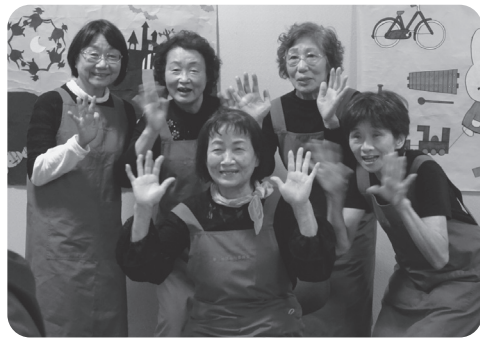
スタッフ頑張っています

10月22日(木)いよいよ第一回の開催となりました。ZOOMのことは全く解らないスタッフです。参加者の入力、オンラインリポートなど全面的に社協さんにお世話になりました。もうすぐ1ヶ月の赤ちゃんから4歳の幼児まで6組の参加がありました。とつても緊張しドキドキの中のスタート。子どもの名前を呼びかけると笑顔で手を振る姿にホッとして、手遊び・歌・絵本・紙芝居などスタンプが交替で演じました。何とかプログラム通りに進行。持ち時間丁度の終了でした。