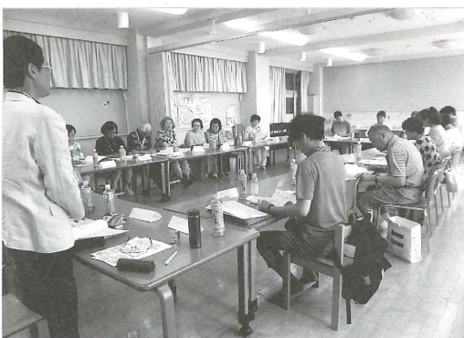
地域活動報告のようす