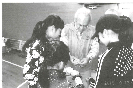
おじちゃん おしえて